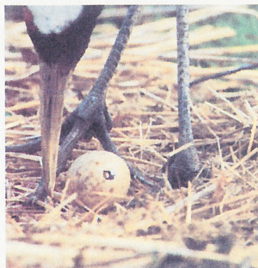
马上就要诞生了 (渐渐看到幼鸟的嘴)

2000年4月开始移交钏路市动物园管辖，藉由此两设施的合作，推动丹顶鹤的保护繁殖工作。