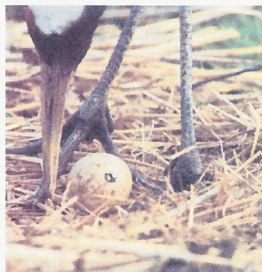
조금만 있으면 탄생 (아기 두루미의 부리가 보인다)

2000년 4월부터 구시로시 동물원에 이관되어, 양시설이 연계하여 보호증식에 힘쓰고 있습니다.