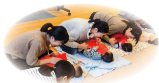
スキンシップ遊び