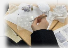
※写真はレジン工作です。