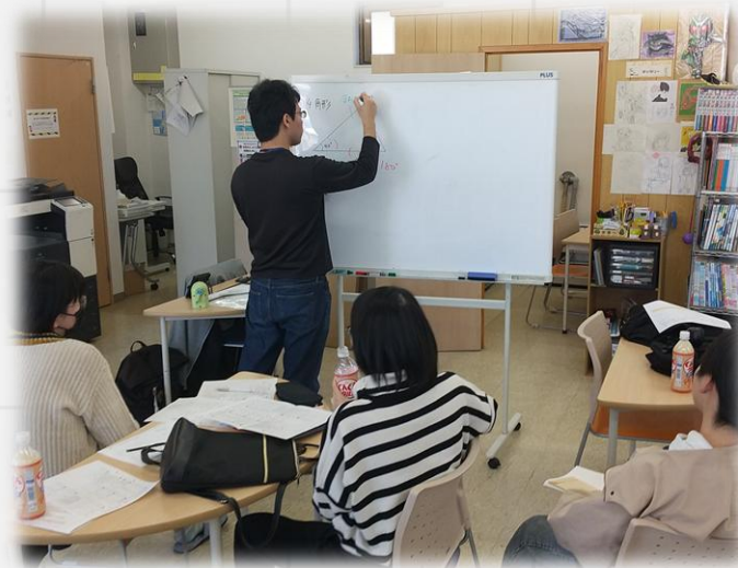
普段の勉強の様子