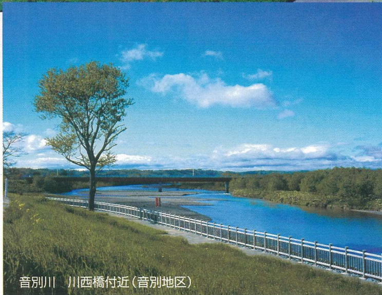
音別川 川西橋付近(音別地区)