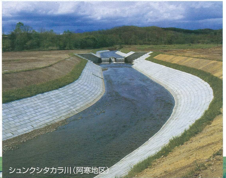
シュンクシタカラ川(阿寒地区)