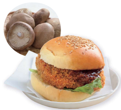
しいカツバーガー

音別産の特大しいたけを使ったご当地バーガーです。肉厚でジューシーな“しいたけカツ”が食べごたえ満点!