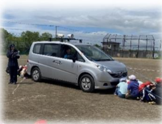
附属釧路義務教育学校（2024）