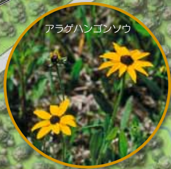
アラゲハンゴンソウ