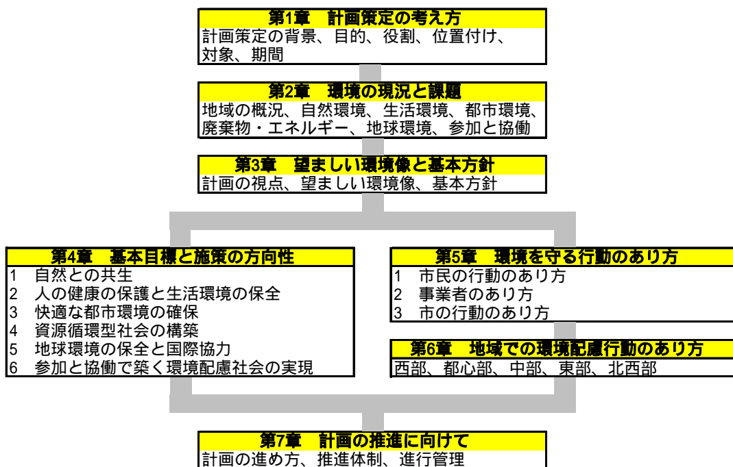
図 2-3-1 釧路市環境基本計画の構成