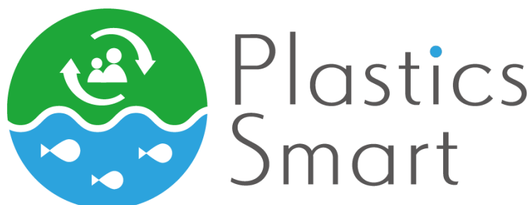
「プラスチック・スマート」のロゴマーク

※ 海ごみゼロウィーク公式ホームページに掲載されている活動報告より抜粋しています。