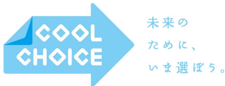
「COOL CHOICE」の統一ロゴマーク

釧路市においても、2017年4月1日付で「COOL CHOICE」に賛同する市長宣言を行っており、市民、事業所、団体と連携しながら地球温暖化対策の取り組みを推進していきます。