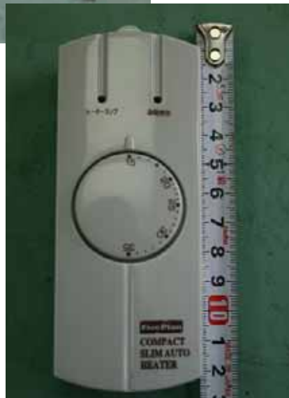
温度コントロール部 同型品