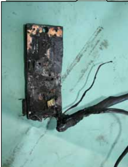
温度コントロール部