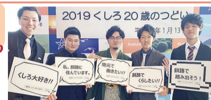
▲昨年の特設ブースの様子

「くしろ20歳のつどい」の釧路会場で、特設ブースを設けてUIターンに役立つ釧路の企業情報を提供します。ぜひ、お立ち寄りください。