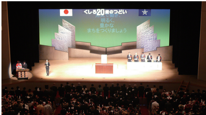
▲昨年の釧路会場の様子

※音別会場は事前に申し込みが必要です。市教委音別生涯学習課 (☎01547-6-2034) へお問い合わせください。