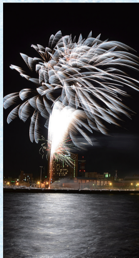
▲道新華火ファンタジア