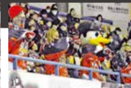
ピリオド間のダンスパフォーマンスの様子です。会場を盛り上げています!