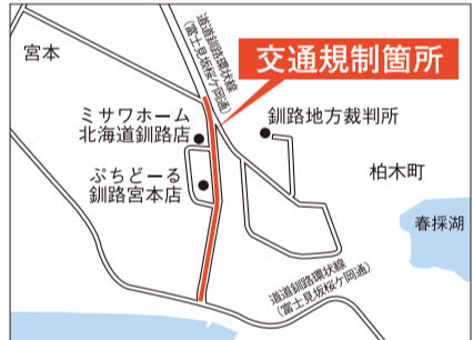
回上下水道部水道整備課建設担当(回43-2163)

回～22(令和4)年2月下旬(午前8時～午後5時)※一部、夜間工事・片側交互通行等も行います。