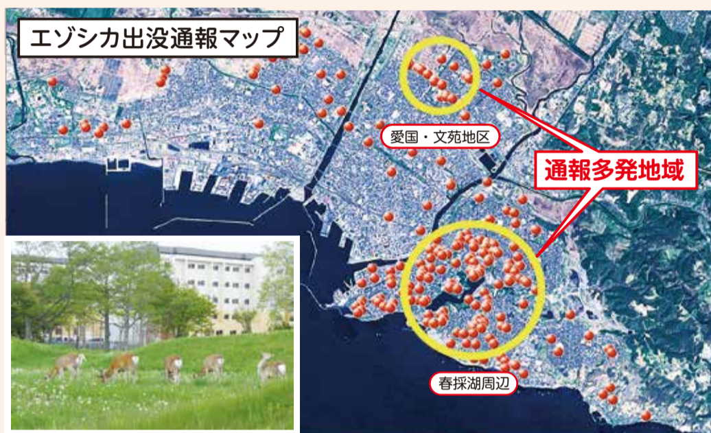
▲市街地に出没したエゾシカの群れ

エゾシカは、追い回したり刺激したりすると興奮状態となり、道路に飛び出す可能性があるため危険です。近寄らずに遠くから見守ってください。運転の際には、市街地にあっても急な飛び出しにご注意ください。