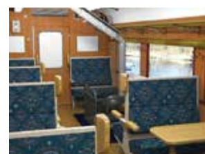
ストーブカー3・4号車客室イメージ