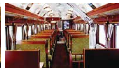
ストーブカー2号車(カフェカー)客室イメージ