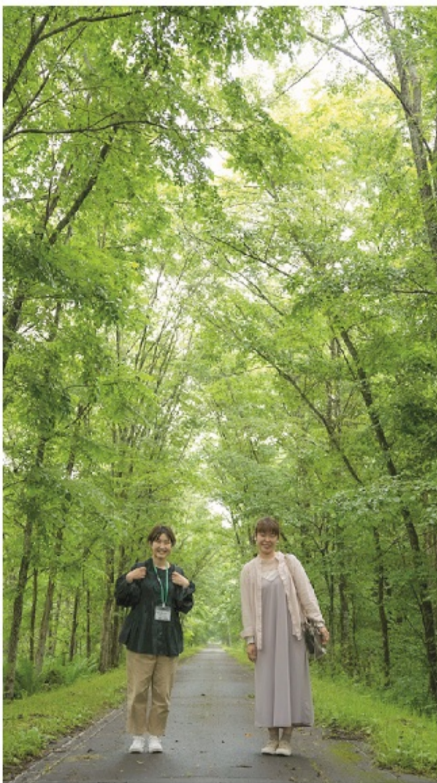
釧路阿寒自転車道にて

また、今回の意見交換や活動共有は、他地域の協力隊の活動を知るだけでなく、釧路市内で活動する協力隊の活動や、活動に対する想いを深く知ることのできる機会になりました。