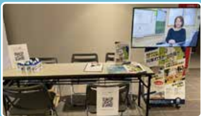
9月13日にウィンドヒルくしろにブース出展した様子

阿寒町に来て約1年3カ月が経ちました。 四季を通して過ごしてみて、私は冬の阿寒がいちばん好きです。雪景色や太陽のまぶしさ、厳しい寒さの中で凛と立つ松の木の姿に心を打たれます。