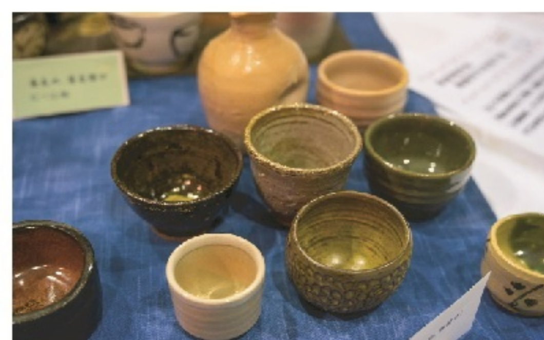
▲ 陶芸サークル「陶好会」の作品

明をしてくれました。この ように、活動を発表できる 場所や機会があるって、本 当に素敵だと思います。