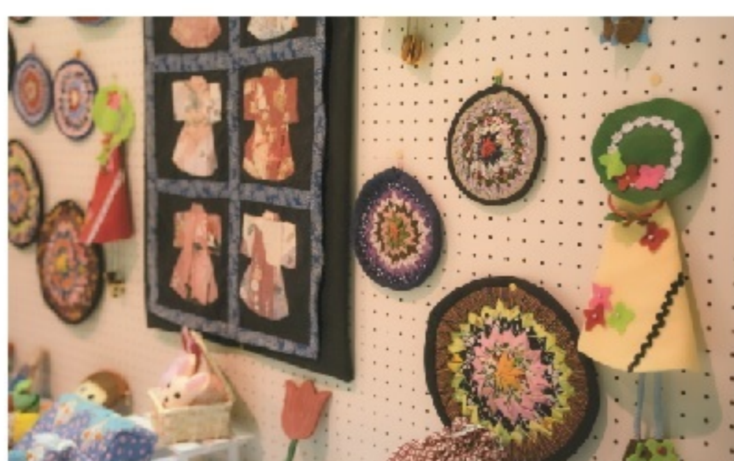
▲ 93歳の方が製作したパッチワーク

阿寒町に住んで一年半経 ちますが、まだまだ知らな い事がたくさん。町での 活動や地域の皆さんの想 いなどをもっと知り、発信 していきたいです。町の面 白いこと、どんどん教えて ください！