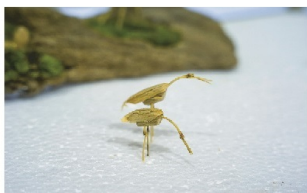
▲ 竹細工のタンチョウ

阿寒町に住んで一年半経 ちますが、まだまだ知らな い事がたくさん。町での 活動や地域の皆さんの想 いなどをもっと知り、発信 していきたいです。町の面 白いこと、どんどん教えて ください！