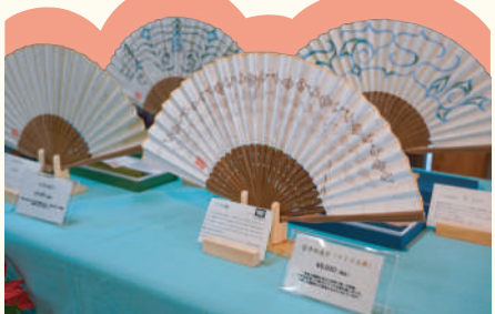
富貴紙を使用したアイヌ文様入り扇子

富貴紙について多くの来場者に紹介させていただく中、「地方の友人に手紙を書くのに富貴紙を使いたい」という方もいらっしや、「釧路の和紙で手紙なんて、もらった相手も喜ぶだろうな〜」と、嬉しい気持ちになりました。