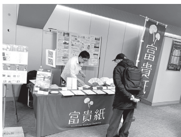
◀音別地域の特産品販売！！

先日、ドローンの安全な運用に関する知識と技術の習得について評価する民間資格、DJI CAMP SPに合格しました！次は国家資格の二等無人航空機操縦士への合格を目指します！！