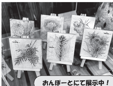
◀富貴紙絵画を制作しました！