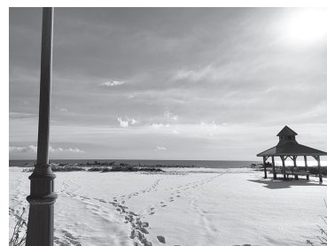
◀パシクル湖畔の景色

12・1月とあっという間に過ぎ去ってしまいましたが、思い返すと様々なイベントや人との交流、初めての取り組みがありました。イベントでの富貴紙漉き体験の実施や音別地域の特産品PRをはじめ、12月上旬には菊芋の最後の収穫作業のお手伝いをさせていただいたり、12月中旬にはおんぼーとで開催したクリスマスイベントの準備・運営に携わったり、またチラシやポスター等制作するデザイン業務を受け持つということもありました。