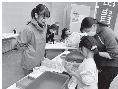
◀12月16日(土) くしろ物産まつり