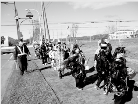
はじめて広場を飛び出でのパレード！