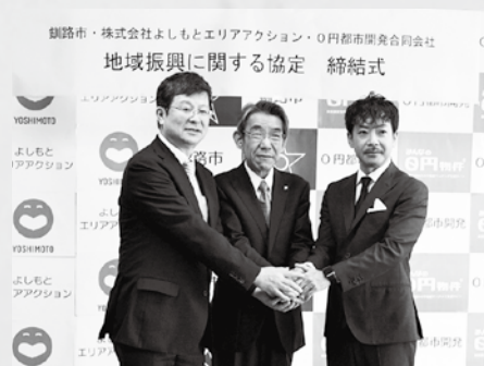
▲10月25日(水)鉦路市観光国際交流センター