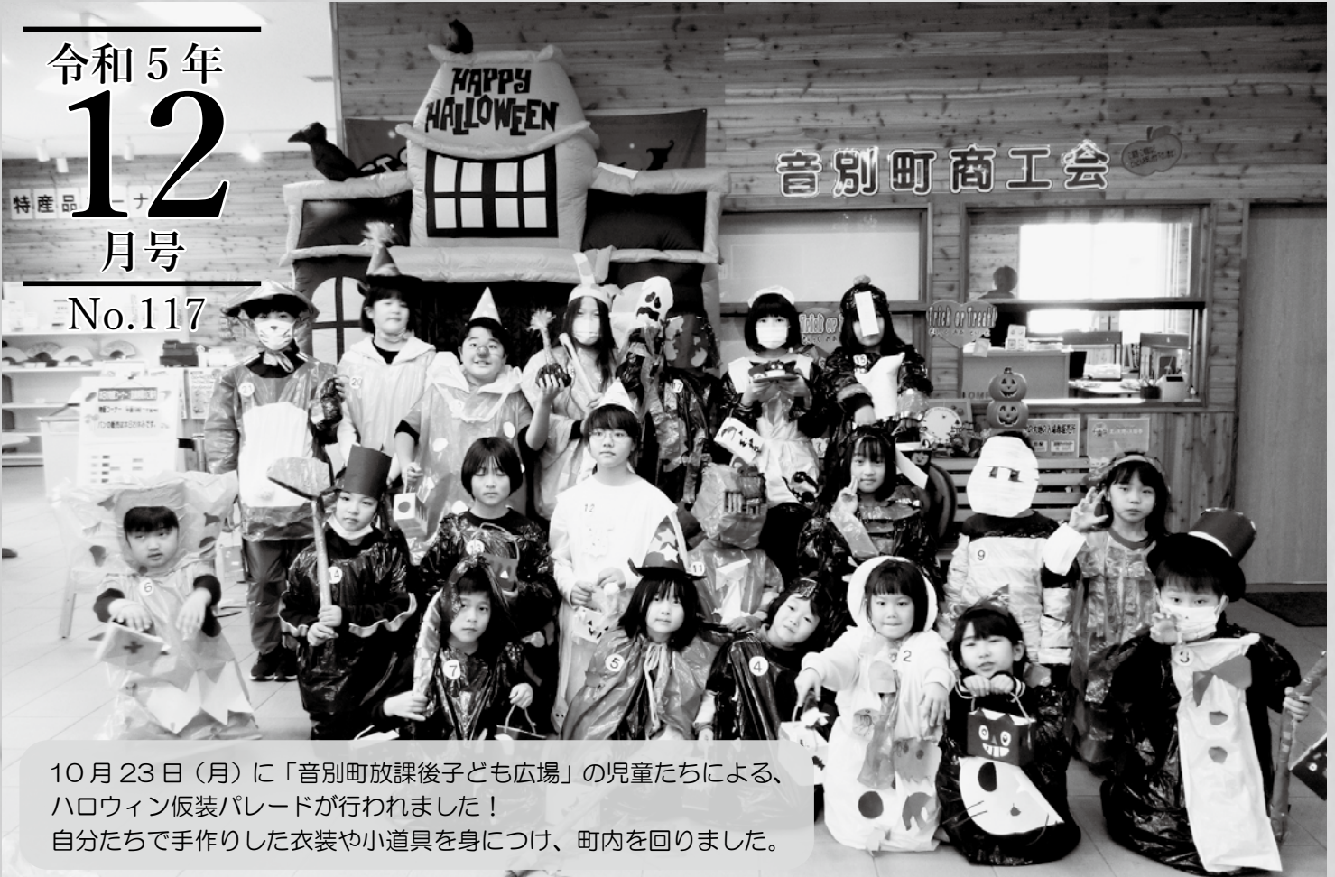
10月23日(月)に「音別町放課後子ども広場」の児童たちによる、ハロウィン仮装パレードが行われました！ 自分たちで手作りした衣装や小道具を身につけ、町内を回りました。