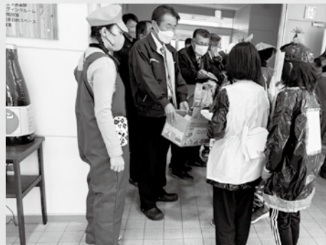
トリックオア トリート！！ お菓子をたくさん もらいました！