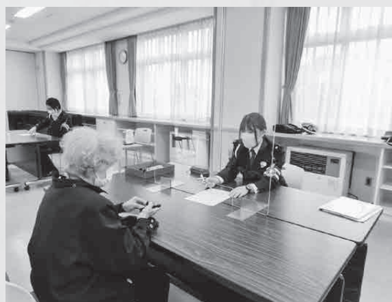
▲10月13日（木）音別町コミュニティセンター内

ご自身やご家族の方の運転免許証返納の相談については、年中受け付けており、「運転に自信がなくなった」「家族から心配と言われた」など、運転に不安のある方は、重大な事故を起こしてしまう前に、音別駐在所までご連絡ください。