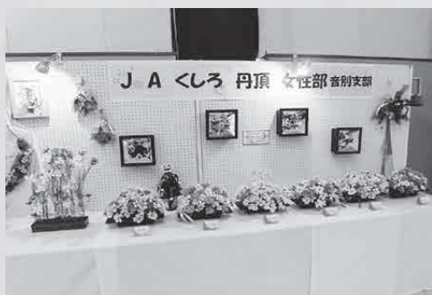
▲10月22日(土)～30日(日)で行われた作品展示

両部門ともに新型コロナウイルス感染症対策のため別日程で万全を期しての開催となりましたが、ご来場・ご参加の皆様には、ご協力いただきお礼申し上げます。