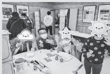
▲10月15日（土）～16日（日） おんべつ鉄道フェスティバル

富貴紙のPRになりましたし、より多くの方々に釧路市の和紙「富貴紙」を身近に感じていただけるよう、今後もPR活動に取り組んでまいります。