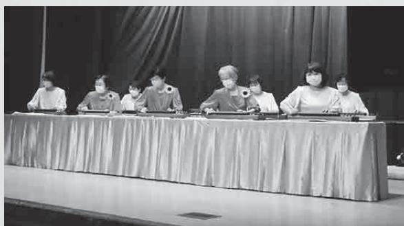
▲11月3日(木)に行われた舞台発表