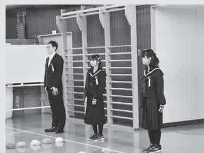
▲3月15日 音別中学校卒業式 (卒業生10名)