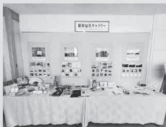
地域おこし協力隊活動展示

47歳。釧路市出身。2020年10月1日から、音別地域の観光振興や地場産物を普及推進する地域おこし協力隊として着任。趣味は散歩で、1日1万歩を目標にしています。