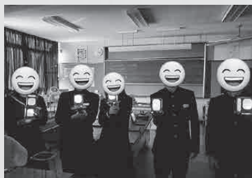
鶯敷中学校とのオンライン交流

コロナの影響により、イベント参加が見送りとなり、富貴紙の展示・紹介・販売活動が思うようにいかなかった2ヶ月間でしたが、山花温泉リフレ様ご協力のもと、当該施設で私を含めた釧路市の地域おこし協力隊6名の活動展示が行われました。