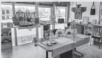
MOO2階「くしろグローバルぶらざ」

前号からの2ヶ月間では、イベント参加による展示販売を行っているほか、フィッシャーマンズワーフMOO 2階にある「くしろグローバルぶらざ」では、常設で富貴紙製品の展示販売を行っていただけることになりました。