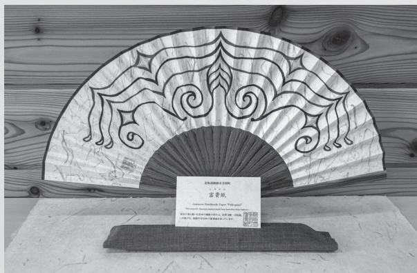
郷右近富貴子氏 制作デザイン