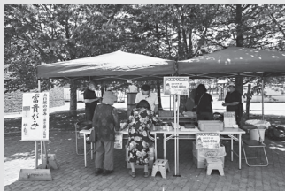
阿寒国際ツルセンター前 「クレインズガーデンこどもひろば」

イベントでは、「地方の友人に会えないから、釧路の富貴紙で手紙を書く」と原紙をお求めになった方がおり、「富貴紙の手紙なら、もらった方もより嬉しいだろうな～」と感じました。