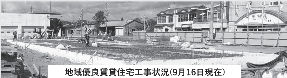
地域優良賃貸住宅工事状況(9月16日現在)