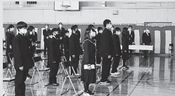
▲ 4月7日（水）音別中学校入学式