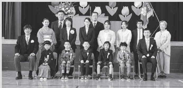
▲ 4月6日（火）音別小学校入学式