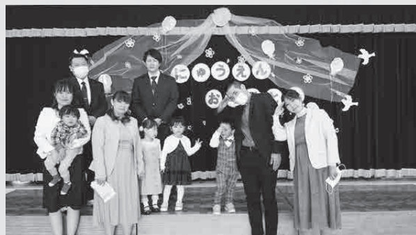
▲ 4月9日（金）音別認定こども園入園式