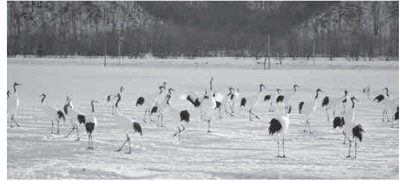
イメージ：タンチョウ

締切は9月25日（金）迄となっております。詳細及び応募用紙は別紙回覧で各世帯に配布いたします。たくさんのご応募お待ちしております。