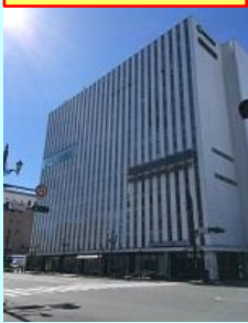
釧路市中央図書館