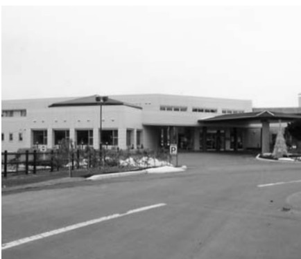
振興公社事務所が移転した山花温泉リフレ

理事者は、今後、経営健全化に向けての取り組みを進める中で、市民に対するわかりやすい形での説明なども検討していかなければならないと答えました。