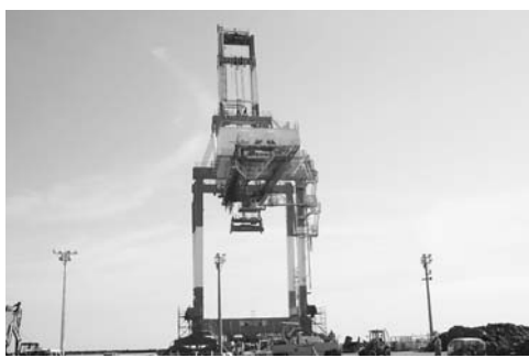
西港第3埠頭に設置中のガントリークレーン

理事者は、使用料収入の基礎となる貨物量については、釧路港湾協会が推計した潜在的貨物量を基礎に算出した。また、維持管理費では、同クレーンの耐用年数を17年で設定し、製作会社からの聞き取