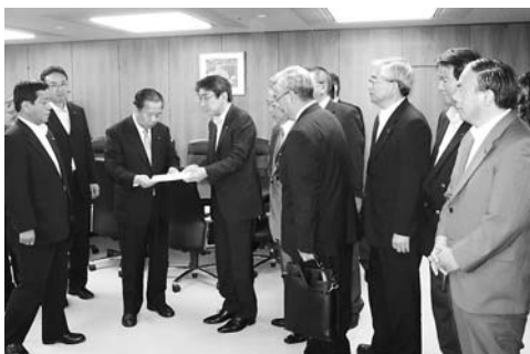
高度化事業継続に向けた要望行動

高度化事業の継続に向け各方面への周知を研究 産炭国石炭産業高度化事業の継続に向けた要望行動においては、同事業が国際貢献に資することをより広く周知していくべきである。例えば、石炭産業に関する国際的なフォーラムの開催などを国等の関係機関に働きかけるなど、同事業の周知を図ることについてどのように認識しているかとの質問がありました。