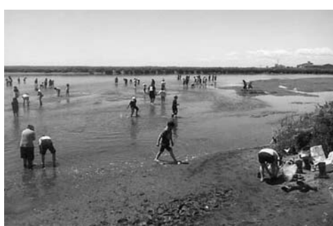
地域住民に親しまれていた当時の阿寒川河口付近

〔 河川管理者である道は、現在、整備に向けた計画策定に着手しており、年度内に地域の方々と協議し、計画をまとめる予定である。〕