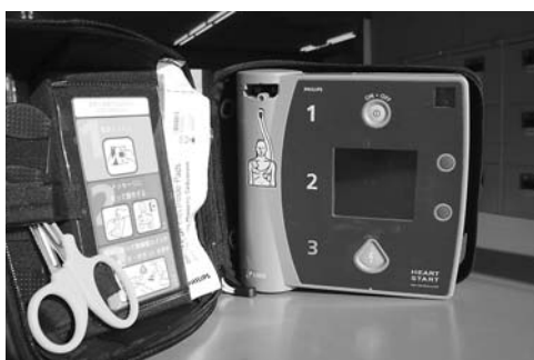
AED (自動体外式除細動器)

これまで以上の早期対応に努めていきたいと答えました。 市内の全小学校にAEDの早期配置を地域活性化・経済危機対策臨時交付金を活用して、市内の全中学校にAEDを配置するとの補正予算案は評価した。しかし、小学校への配置予定が見送られたことに対する見解を聞きたいとの質問がありました。