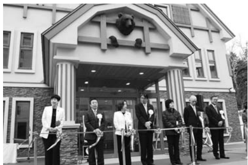
合併を契機に建てられた阿寒湖まりむ館

〔 合併時に目指したまちづくりのその後の経過を今年度しっかりと検証し、今後の市政運営に生かしていきたい。〕